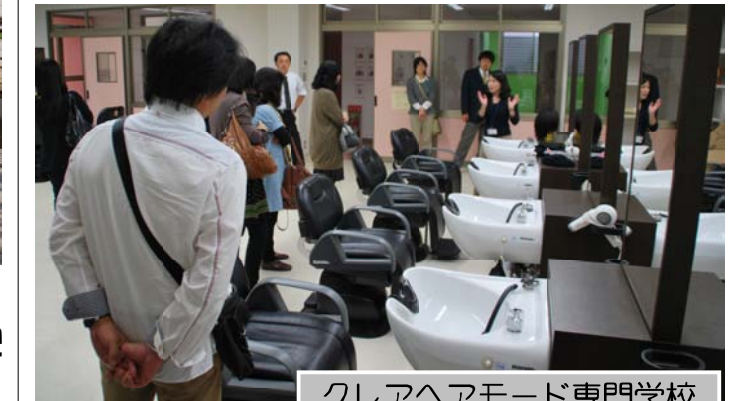
クリアヘアモード専門学校